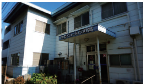
2階建てで 22 床の施設