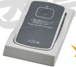
カード型送信機 STR-CG-HD 壁やテーブル下の設置が可能。