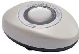
スリム型送信機 STR-S 拡張性の高い送信機

特定小電力無線なので簡単設置・簡単移設。 見通し距離100m。無線の中継機もあります。