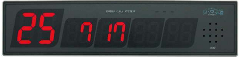
片面/両面受信表示機 SRE-K/R 番号を表示する受信表示機。 遠くからも見やすいデザインで、チャイムの種類は14種類。 番号は携帯受信機や、タイマーで消すことができます。