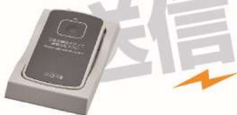
カード型送信機 STR-CG-HD 試着室の壁に設置が可能。