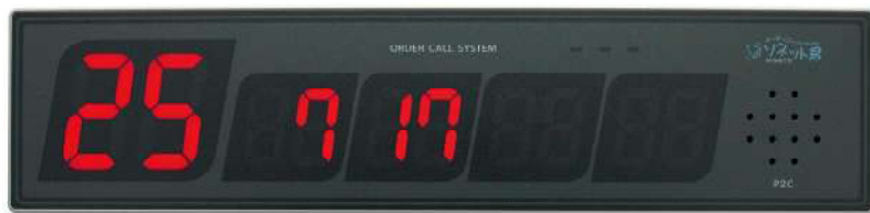
片面/両面受信表示機 SRE-K/R

番号を表示する受信表示機。 遠くからも見やすいデザインで、チャイムの種類は14種類。 番号は携帯受信機や、タイマーで消すことができます。