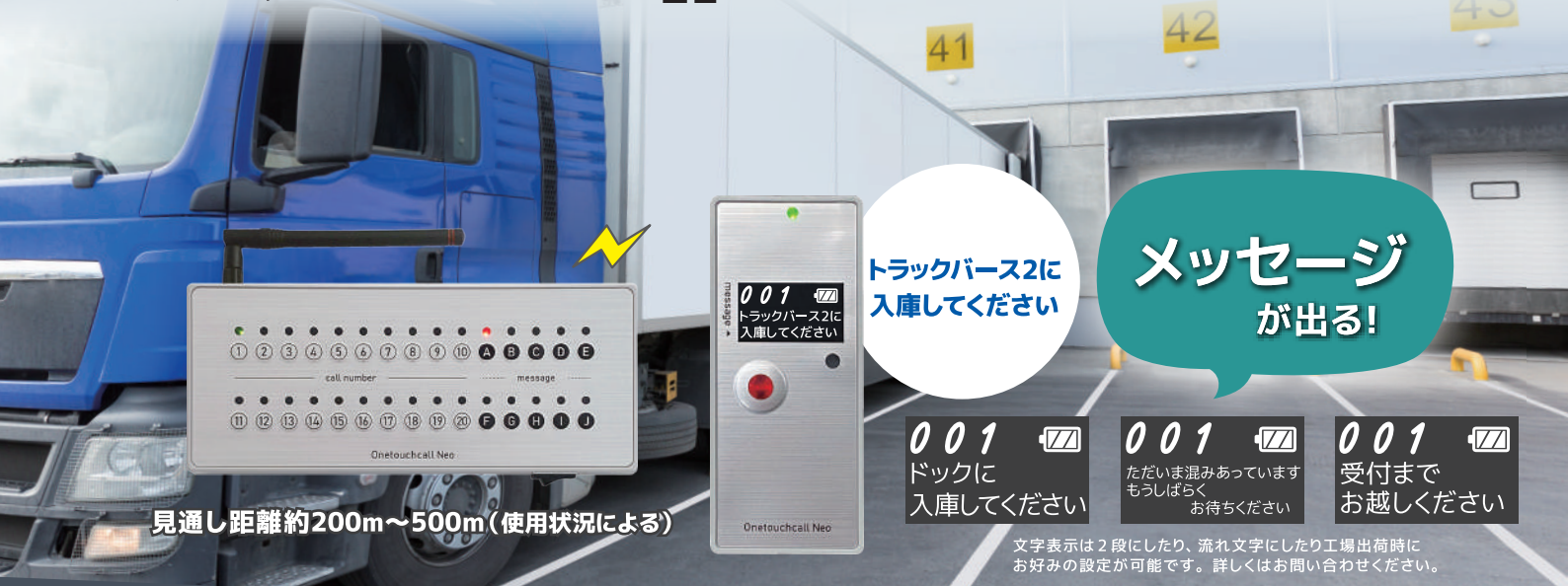
見通し距離約200m~500m(使用状況による)